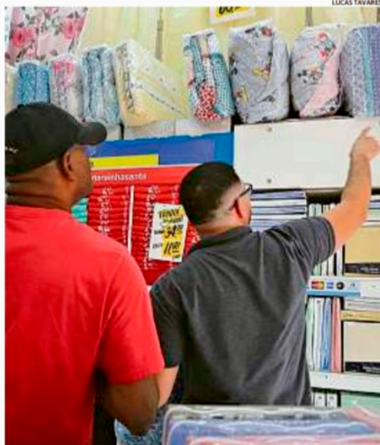
O reajuste vai alcançar 12 mil trabalhadores do comércio no Rio

Com o reajuste, os empregados passam a ter um piso salarial de R$ 1.374 de 1º de maio a agosto de 2022, passando para R$